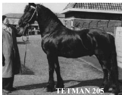
L'étalon Jarich 226, avec 106

filles inscrites, dont 72 Ster et 5 fils Studbook, est donc un stempelhengst très important. En 1965, quand il fut inscrit au Studbook à l'âge de 3 ans, les éleveurs n'étaient pas très enthousiastes. Jarich avait une grosse tête pas vraiment belle, et avec 1.64 m au garrot, tout le monde trouvait qu'il était beaucoup trop grand. A 3 ans, il était très peu représentatif de la race, mais sa lignée de sang était magnifique avec très peu de consanguinité . Sur ces 5 fils inscrits, l'aîné Wessel 237P, est de loin le plus important. Wessel a eu 6 fils inscrits, dont Oege 267P . En 1959, Wessel avait 200 filles inscrites, dont 150 Ster et 21 Model.