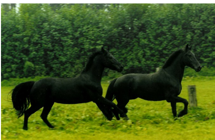
Oxyblom & Oxeida au début des années 2000